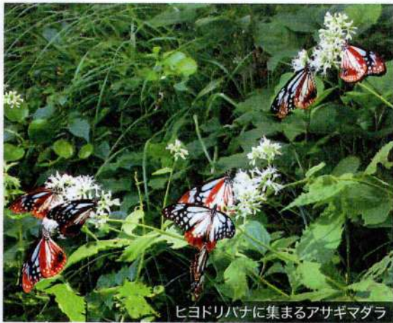
ヒヨドリバナに集まるアサギマダラ