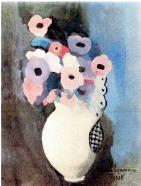
マリー・ローランサンの絵画