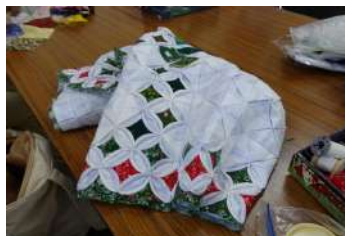
ミニサロン手芸コーナー