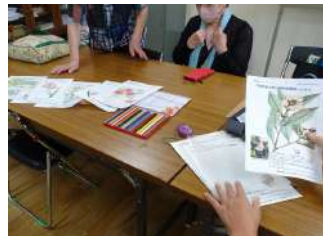
ぬり絵入門コース