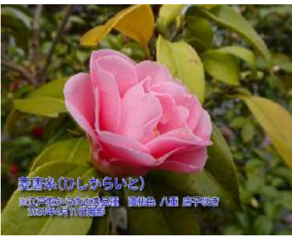
菱唐糸(ひしからいと)