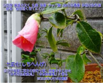
七変化(しちへんげ)