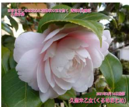
久留米乙女(くるめおとめ)