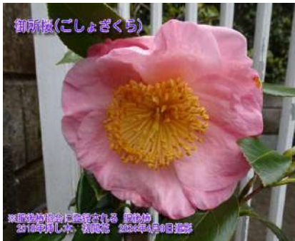
御所桜(ごしよざくら)