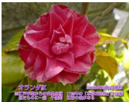
オランダ紅 ※2023年4月19日撮影 ※江戸中期からの古典品種 1739年の「本草花時絵」に記載 ※花の中心に一重、千輪菊、玉菊の花が咲く