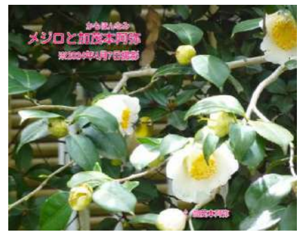
メジロと加茂本阿弥