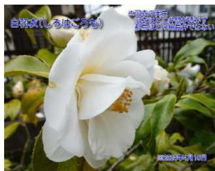
白羽衣(しろはごろも)