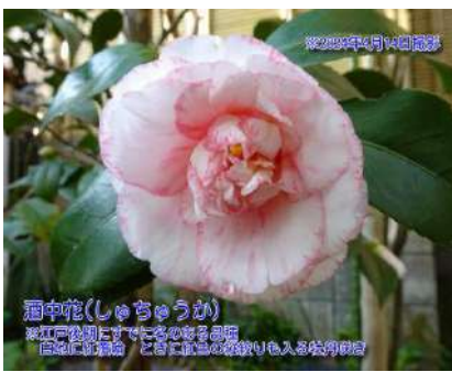
酒中花(しゅちゅうか)