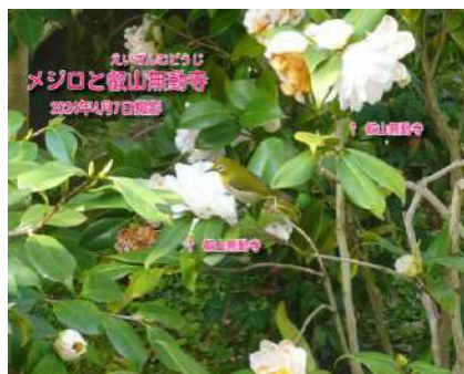
メジロと叡山無動寺