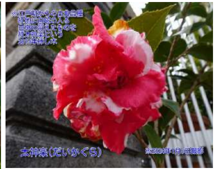
太神楽(だいかぐら)