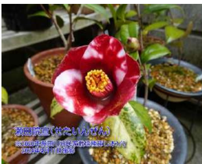
瀬田院宣①(せたいんぜん)

濃紅地に白斑の入る 一重 筒～ラップ咲き 小輪 2020年挿し木 瀬田川浴民家栽培種