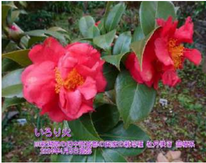
いろり火 ※新潟県の旧中頸城郡の民家の栽培種 松月敬司 創作系 2023年4月19日撮影