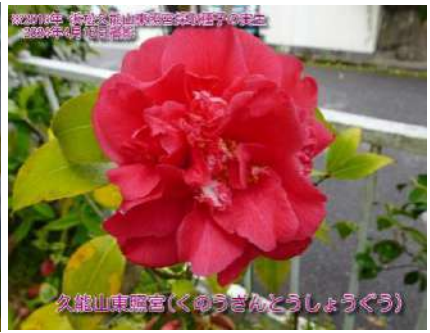
久能山東照宮(くのうざんとうしょうぐう)