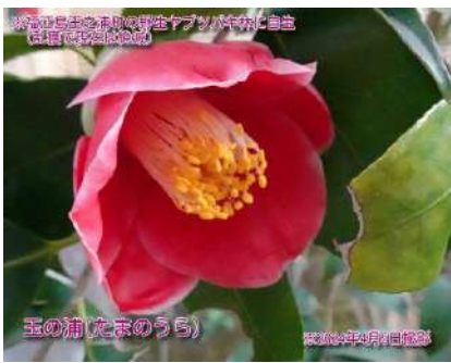
玉の浦(たまのうら)