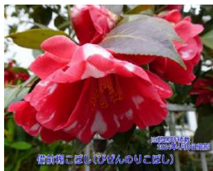
備前糊こぼし(のりこぼし)