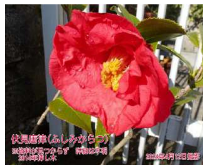
伏見唐津(ふしみからつ)