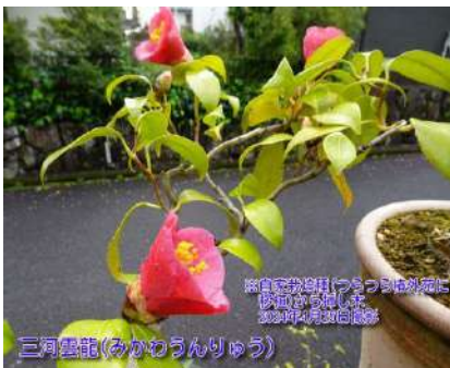
三河雲龍(みかわうんりゅう)