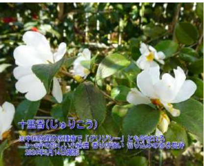
十里香(じゅうりこう)

中国原産原種椿で 別名:グリジシー 3 江戸期に京都伏見・桃山辺りの出生 ～6弁の珍しい小輪種