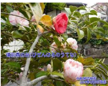
備前春の台(ひぜんはるのうてな)