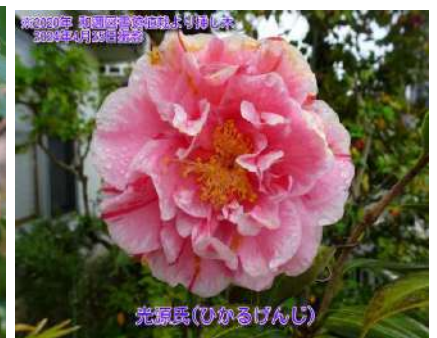
光源氏(ひかるげんじ)