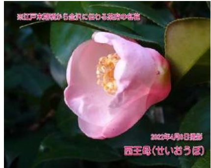
西王母(せいおうぼ)