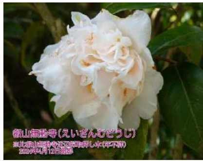
叡山無動寺(えいざんむどうじ) ※比叡山無動寺近辺採取挿し木(松月敬司) 2023年4月12日撮影