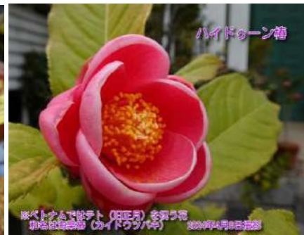
ハイドゥーン椿 ※ベトナムではテト(旧正月)を祝う花 和名は海棠椿(カイドウツバキ) ベトナム原産

クロツバキとルビーベルの交配種 NZ産 2020年挿し木 親樹はつらつら椿外苑に移植