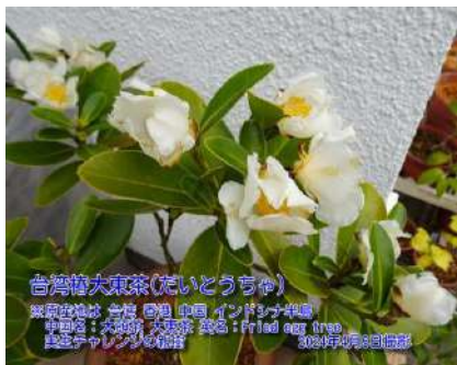
台湾椿大東茶(だいとうちゃ)

原産地は 台湾 香港 中国 インドシナ 半島 英名:Fried egg tree 2015年挿し木