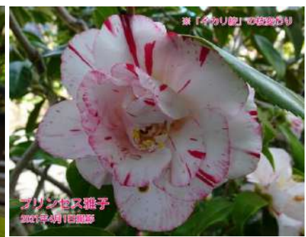
プリンセス雅子(まさこ)