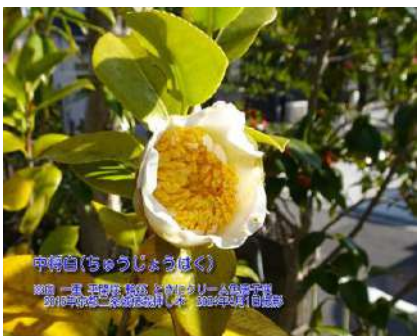
中将白(ちゅうしょうはく)