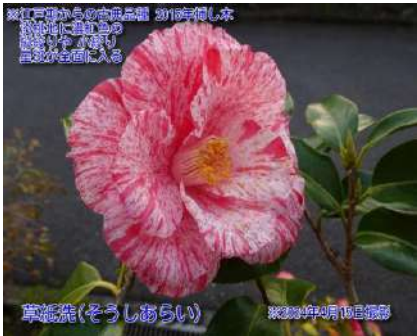
草紙洗(そうしあらい)