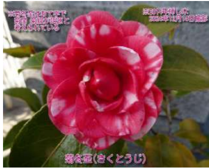
菊冬至(きくとうじ)

尾張地方の古花 名古屋開府400年記念の「尾張椿名鑑」に「別格貴品」として名が記される