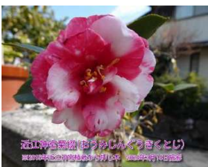
近江神宮菊綴(きくとじ)

葉に特徴があり 緑地に黄覆輪の斑 さらに淡緑斑もその間に現れる三色錦葉覆輪一休の枝変わり