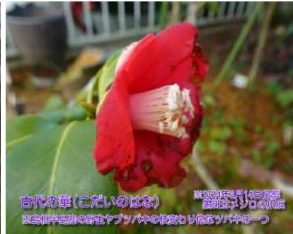
古代の華(こだいのはな)

1695年の「花壇地錦抄」に記載されている江戸古種 椿花集『七木』のひとつ 2015年挿し木