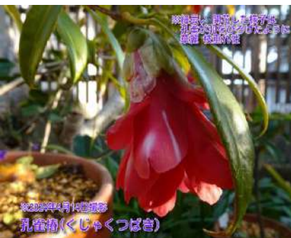
孔雀椿(くじゃくつばき)