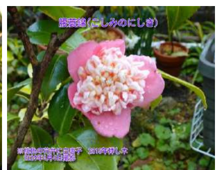
腰蓑錦(こしみのにしき)