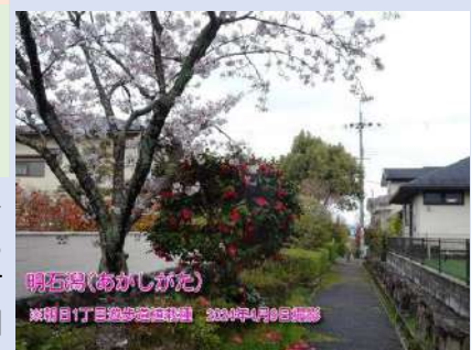
あしがた 朝日Ⅰ遊歩道の明石湯