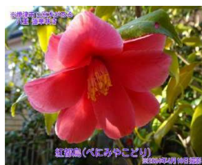
紅都鳥(べにみやこどり)