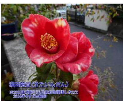
瀬田院宣②(せたいんぜん)

濃紅地に白斑の入る 一重 筒～ラップ咲き 小輪 2020年挿し木 瀬田川浴民家栽培種