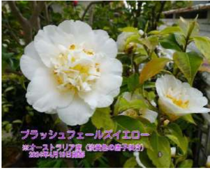
ブラッシュフェールズイエロー