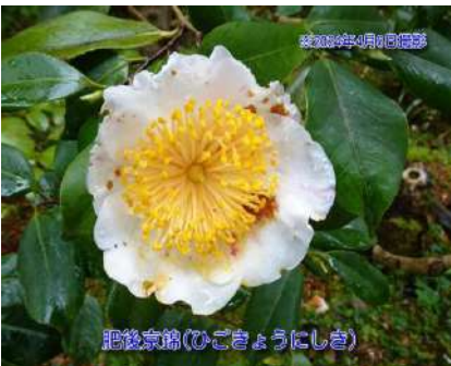
肥後京錦(ひごきょうにしき)