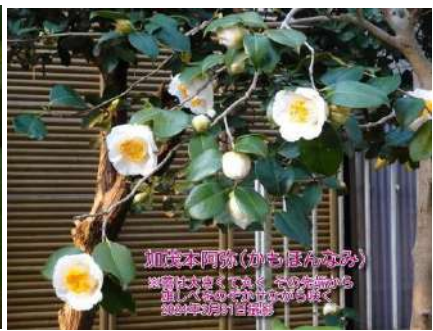
加茂本阿弥(かもほんなみ) ※蕾が大きくて丸く、その先端から雄しべをのぞかせながら咲く 2024年3月31日撮影