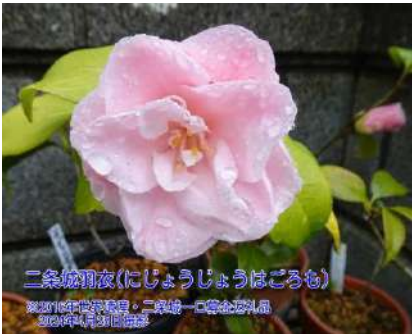
二条城羽衣(はごろも)