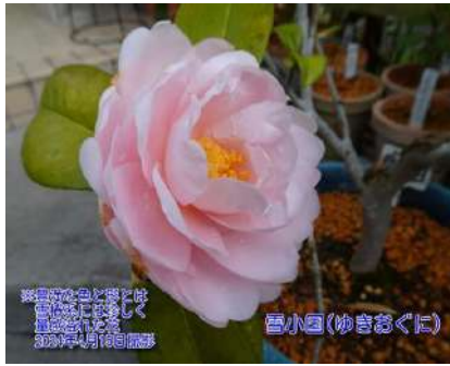
雪小国(ゆきおぐに)

太郎冠者によく似ておりその実生関係を 思わせる 別名 昭和侘助 柳葉侘助 2015年挿し木