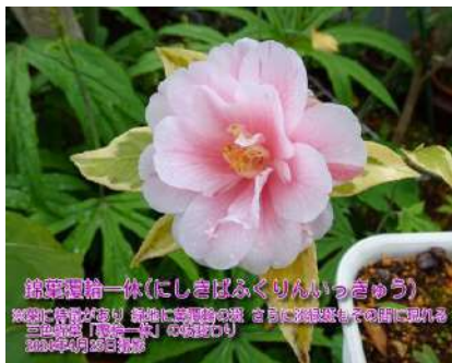
錦葉覆輪一休(にしきばふくりん)

1695年の「花壇地錦抄」に載る古い品種 別名:白菊(しらぎく) 2015年挿し木