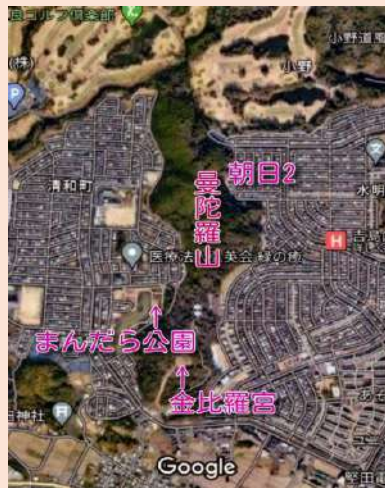
まんだら山外周の 散策コース