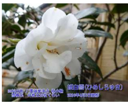
姫白雪(ひめしらゆき)

※純白色 八重蓮華咲き 極小輪 雪椿系 弁数は20枚くらい 2024年4月8日撮影