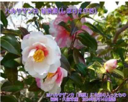
ハルサザンカ 絞笑顔(しばりえがお) ※ハルサザンカ「笑顔」に白斑が入ったもの 信州・大森町産 2024年4月14日撮影

ベトナムではテト(旧正月)を祝う花 和名は海棠椿(カイドウツバキ) ベトナム原産