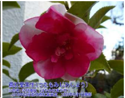
早見濱風(はやみはまかぜ)