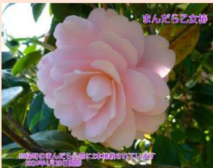
まんだら乙女(仮称)