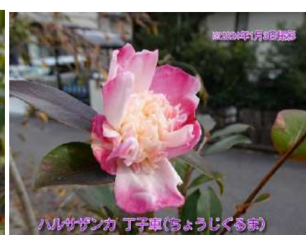
ハルサザンカ 丁子車(ちょうじくるま)

ハルサザンカ丁子車(ちょうじくるま) 京都竹田街道民家植樹 挿し木 (年不詳) 唐子咲き(丁子咲き)