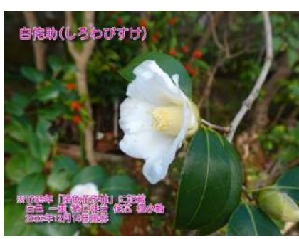
白侘助(しろわびすけ)

※1789年「諸色花形帖」に記載 白色一重(初霜)と梅芯(初嵐) 2024年4月10日撮影