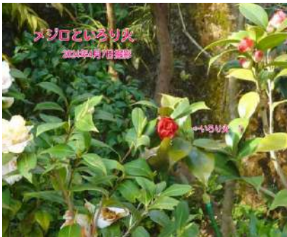
メジロといろり火