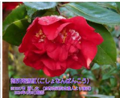
御所南蛮紅(ごしよなんばんこう)