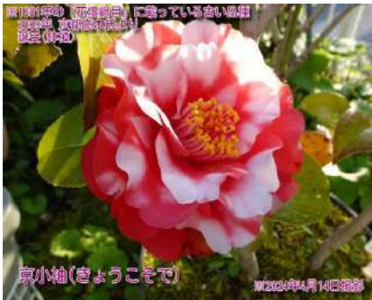
京小袖(きょうこそで)