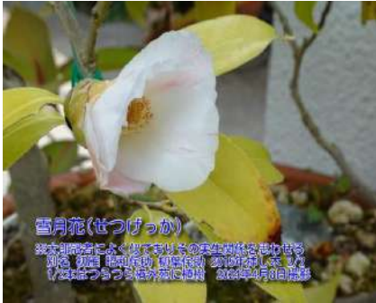
雪中花(せつちゅうか)

太郎冠者によく似ておりその実生関係を 思わせる 別名 昭和侘助 柳葉侘助 2015年挿し木