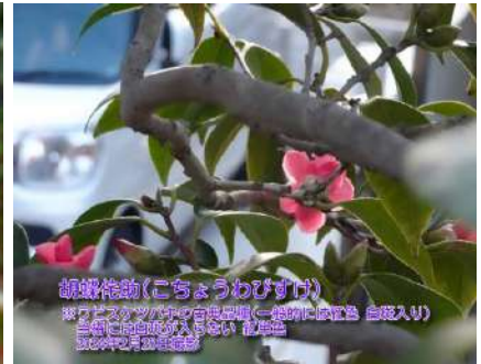
胡蝶侘助(こちょうわびすけ)