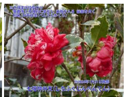
七福神弁天(しちふくじんべんてん)