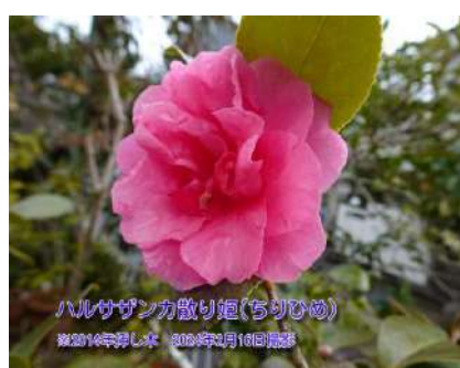
ハルサザンカ散り姫(ちりひめ) ※2014年挿し木 2023年3月18日撮影

ハルサザンカ絞笑顔(しばりえがお) ハルサザンカ笑顔(つらつら椿外苑に移 植)に白斑の入ったもの