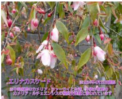
エリナカスケード ※2023年4月19日撮影 ※中国原産のカムリア・ツァーサイと台湾が原産のルチエンスの種間交雑種とされています