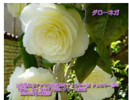
ダローネガ ※品種名はアメリカ先住民のチェロキー族 チェロキー語の「黄色、金」 を表す USA産