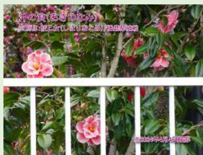
おきのなみ 播磨邸の沖の浪