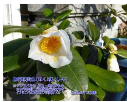
白梅芯(はくばいしん)

※ヤブツバキ(純血系)と梅芯のもの 2016年京都二条城採取種子実生 2024年4月10日撮影