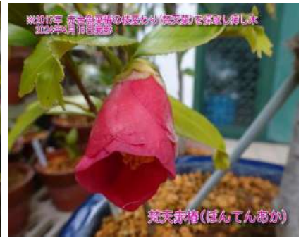
梵天赤椿(ぼんてんあか)