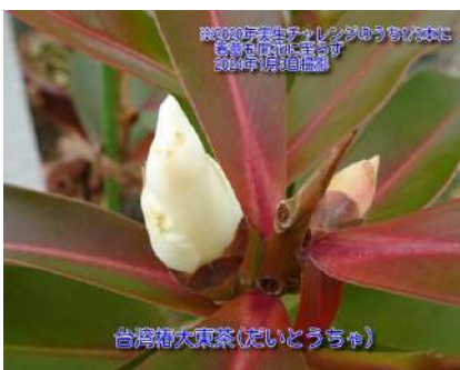
台湾椿大東茶(だいとうちゃ)

原産地は 台湾 香港 中国 インドシナ 半島 英名:Fried egg tree 2015年挿し木