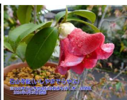
石山寺藪(いしやまでらやぶ)

濃紅地に白斑の入る 一重 筒～ラップ咲き 小輪 2020年挿し木 瀬田川浴民家栽培種