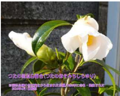
つたの細道白百合(つたのほすからしらゆり) ※園芸品種の自然実生から生まれた品種 長筒咲き 2024年4月19日撮影

品種名はアメリカ先住民のチェロキー族 チェロキー語の「黄色、金」 を表す USA産