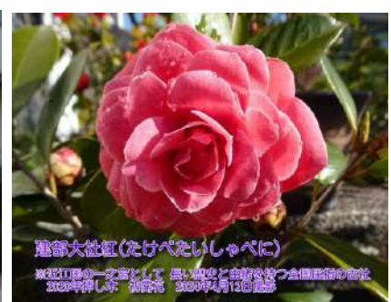
建部大社紅(たけべたいしゃべに)

近江国の一之宮として長い歴史と由緒を持つ全国屈指の古社建部大社境内 2020年採取 挿し木