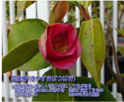
盃葉椿(さかずきばつばき)