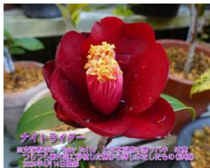
ナイトライダー ※2020年挿し木 2023年4月14日撮影 ※クロツバキとルビーベルの交配種 NZ産 2020年挿し木 ※親樹はつらつら椿外苑に移植