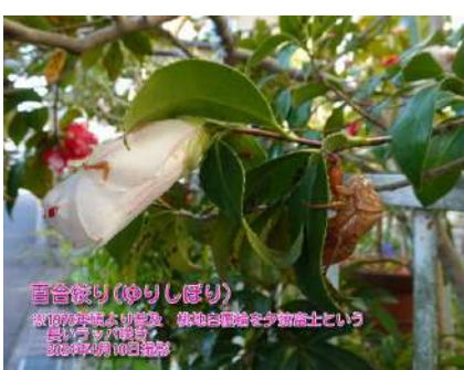
百合紋(ゆりしぼり)

※1970年頃より普及 桃地白覆輪を 夕焼富士という 長いラップ咲き 2024年4月10日撮影